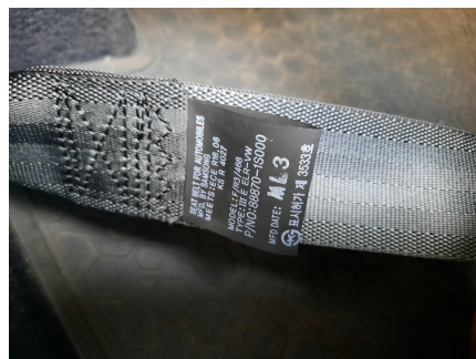
Validade do Cinto de Segurança