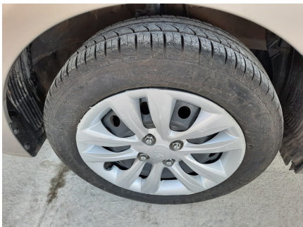
Pneu dianteiro direito