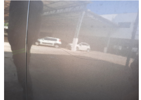
Avaliação Estética - Porta - DD