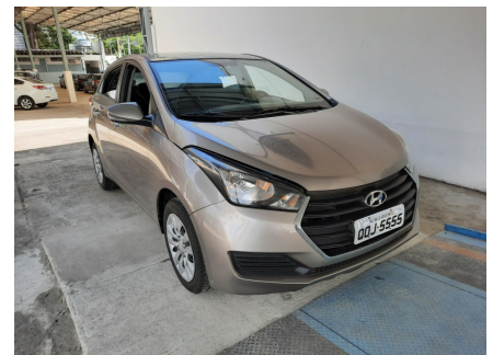
Dianteira Direita 45º