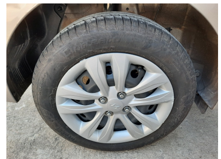
Pneu traseiro direito