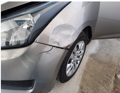
Avaliação Estética - Para-lama DE