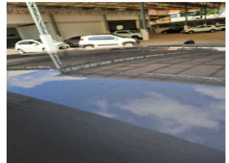
Avaliação Estética - Teto