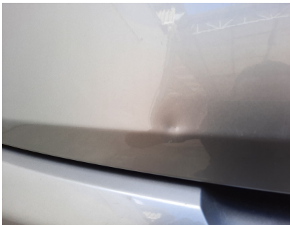
Avaliação Estética - Tampa do porta malas