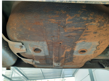
Caixa de Estepe