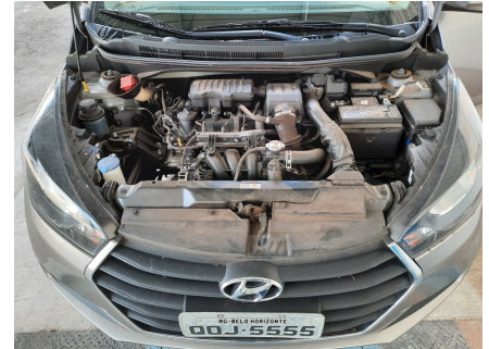
Cofre do motor