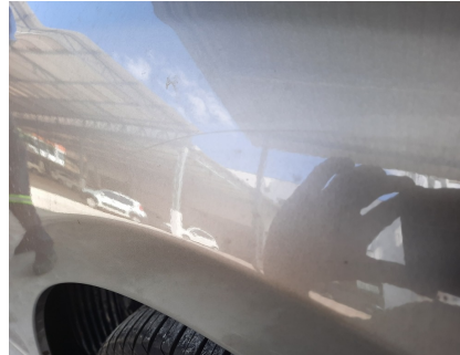
Avaliação Estética - Para-lama DD