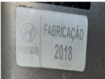
Etiqueta ANO FABRICAÇÃO