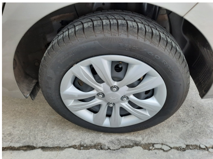
Pneu traseiro esquerdo