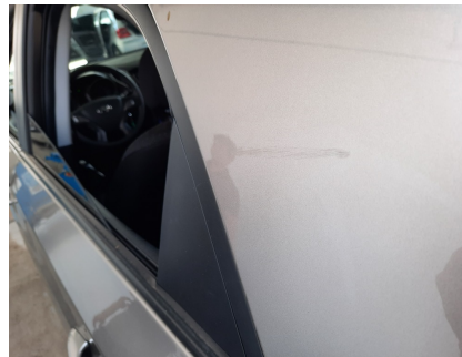
Avaliação Estética - Lateral - TE