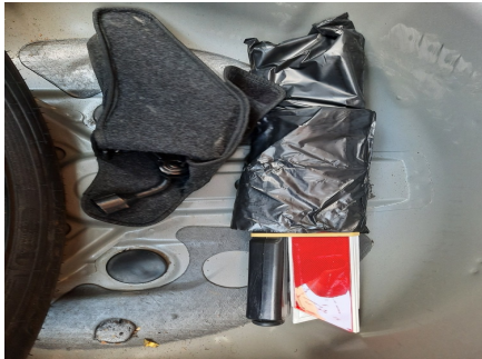
Macaco, chave de roda, triângulo