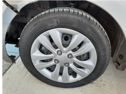
Pneu dianteiro esquerdo