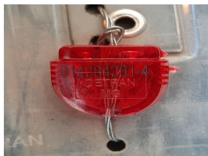
Lacre da Placa Traseira