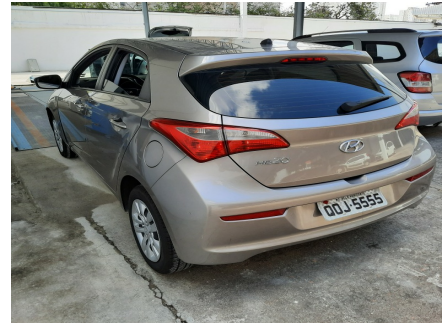
Traseira Esquerda 45°