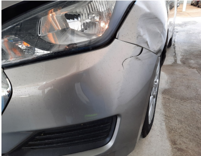
Avaliação Estética - Para-choque dianteiro